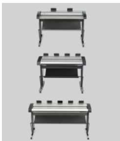
Scanner Ihrer Wahl IQ Quattro X 44 Zoll HD Ultra X 42 Zoll HD Ultra X 60 Zoll