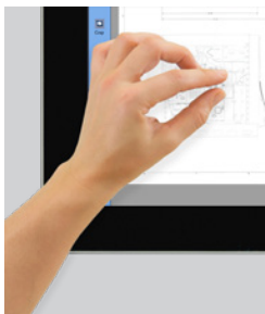
Touchscreen Voll-HD-Touchscreen mit 22 Zoll